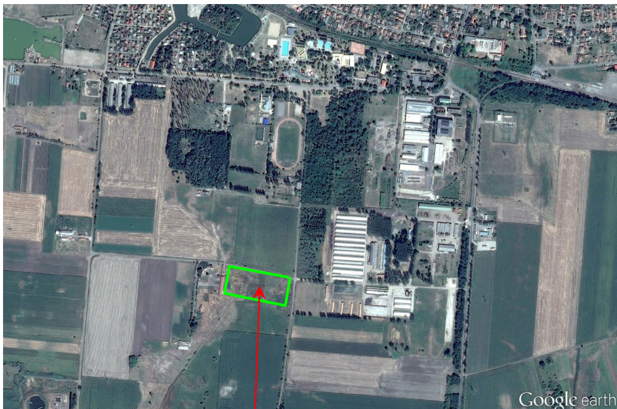
Tervezett lovas centrum helye (Hrsz:0797/49)

A településrendezési terv módosításakor megfelelő lehetőséget teremtenie, a város Helyi építési szabályzatában meghatározott „Ksp-lov” jelű beépítésre szánt különleges építési övezet kijelölése a 0979/49 Hrsz-ú területen.