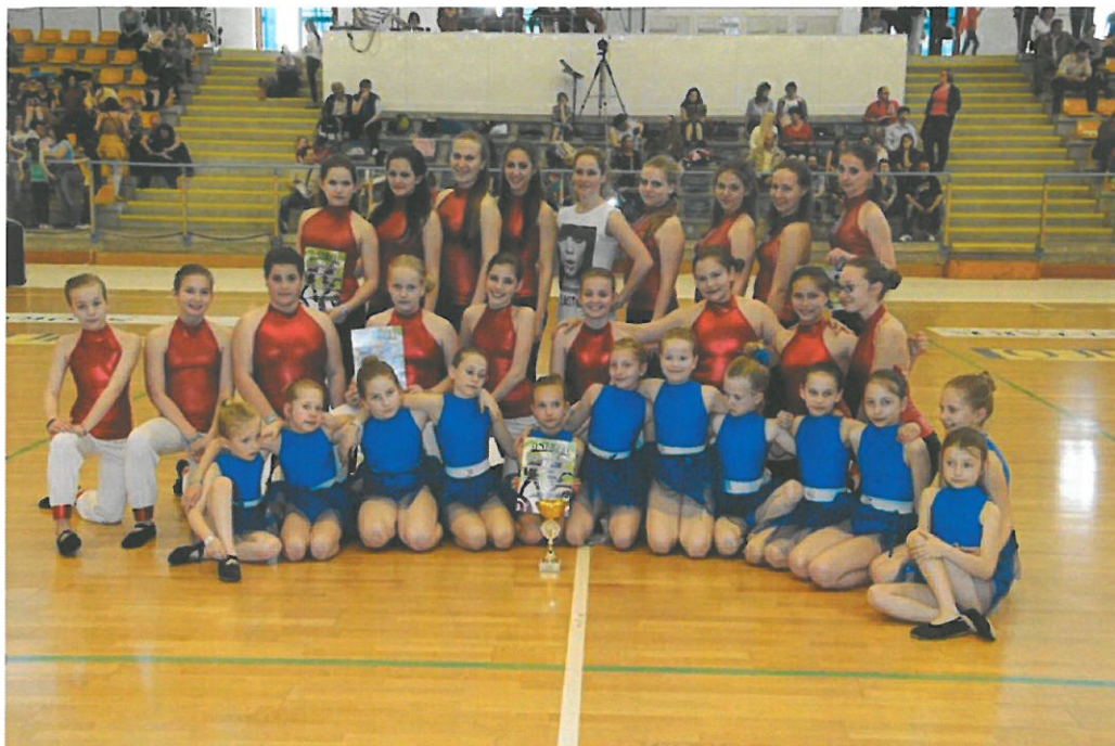
2014. május 16. MLTSZ Országos Bajnokság, Budapest