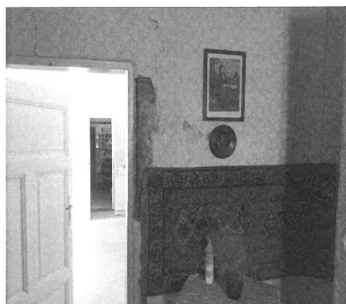
falazat repedései, omlásai