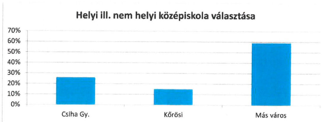
2. sz. diagram

A továbbtanulók közel 60 %-a más városban kíván továbbtanulni. (2. sz. diagram)